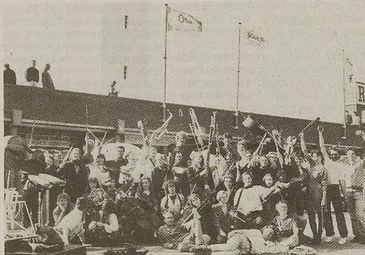
Het ensemble Ricciotti treedt op tijdens het Vlissingse straatfestival en in de grote kerk in Veere

Traditiegetrouw opent de Internationale Straattheaterdag zaterdag het Vlissingse straatfestival (20.00 uur).