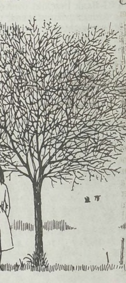
Dat is heel wat voor een kat

was het niet meer te koop. Gottmer heeft het nu opnieuw uitgegeven, en net als in het hierboven beschreven boek in een groter formaat, iets van de subtielste sfeer die de onspronkelijke uitgave zo bijzonder maakte, is daardoor verloren gegaan, toch is het fijn dat het boek er weer is.