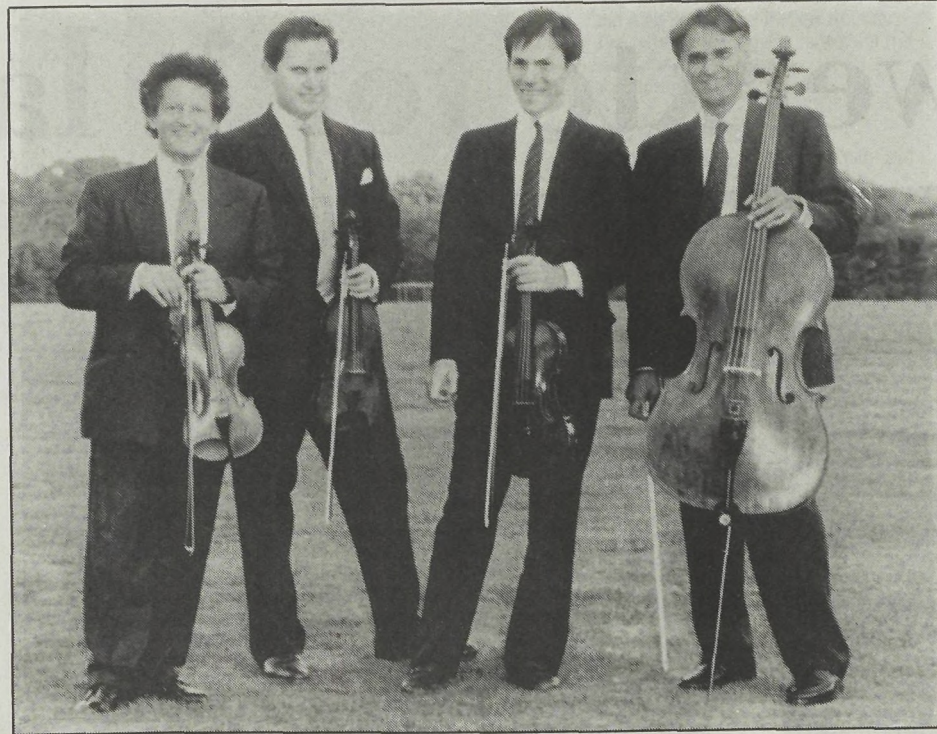
Het Arditti Kwartet