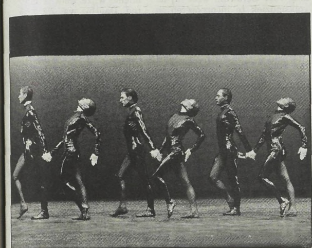
Introdans in de choreografie 'Schlager' van Ed Wubbe

tempo halen ze de grote thema's van het leven overhoop en scheuren met gierende banden door de hersenkronkels van de toeschouwer. Het 'scheermes' blinkt uit in tempo, under-acting en timing. Het is een kaleidoscopische dollemansrit die met piepende remmen tot stilstand komt.